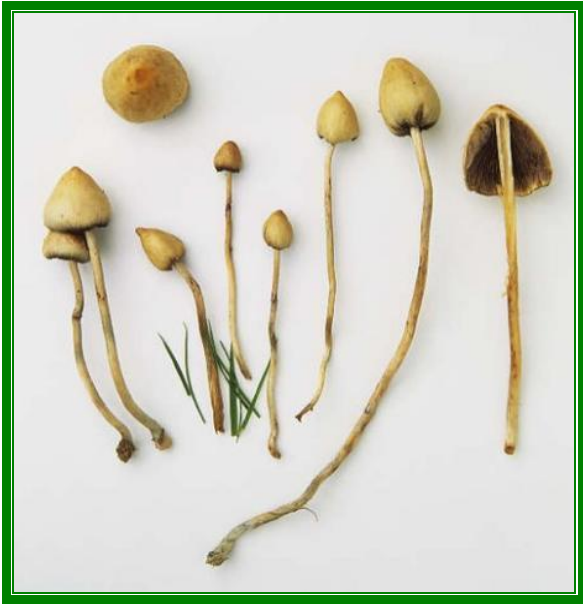
Gweithgaredd enwi'r cyffur